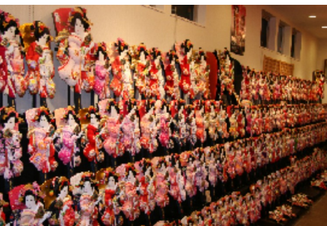
【お問い合わせ】 羽子板のさか田 048 (752) 8585 (代)

初めて展示場に伺った際、室内に所せまじと飾ってある数え切れないほどの押し絵羽子板に圧倒されたことを鮮明に覚えている。これほどたくさんの羽子板があるにも関わらず、同じものは2つとない。それは、人形の顔を面相師の方が一本一本手作りして仕上げていたためであり、表情が一つ一つ違い、味がある。